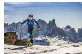
Epic Ski Tour si rinnova e riparte da Davos il prossimo 29 dicembre