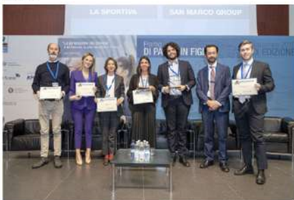
La cerimonia di premiazione del Premio "Di padre in figlio", vinta da La Sportiva.

È andato a La Sportiva, azienda leader mondiale nella produzione di calzature ed abbigliamento outdoor, il premio per l'internazionalizzazione dedicato al passaggio generazionale in aziende a forte presenza sui mercati esteri, capaci di distinguersi sullo scenario globale senza perdere l'anima e la ownership data dalla gestione familiare.