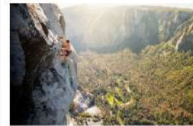
Reel Rock Tour 2019: il meglio dell'arrampicata sul grande schermo