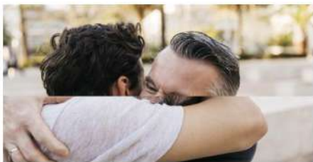
Famiglia foto creata da freepik - it.freepik.com

Redazione - F CRESCIMPIENA # La rassegna dell'anno - 9 Luglio 2019